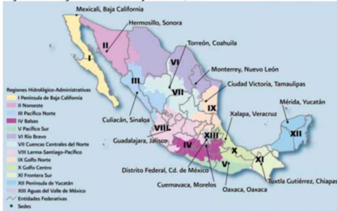
Regiones Hidrológico-Administrativas y sus sedes, 2010

Los datos analizados se obtuvieron de la Comisión Nacional del Agua (CONAGUA), a través de los Distritos de Riego que publica el informe anual de “Estadísticas Agrícolas de los Distritos de Riego”,